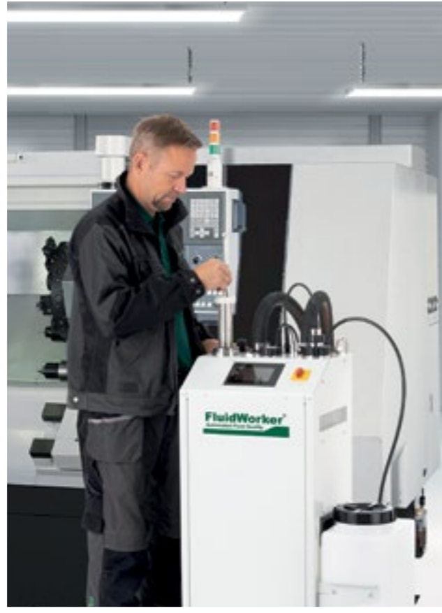
Automatisiertes Flüssigkeitsmanagement durch FluidWorker 150